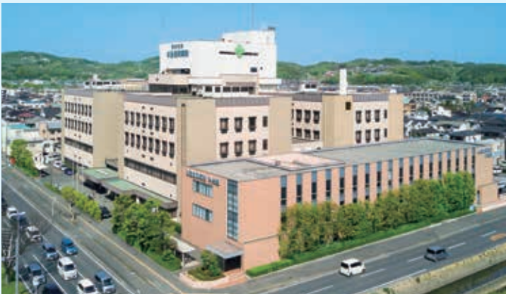
● 総合病院 水島協同病院