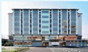
● コープリハビリテーション病院