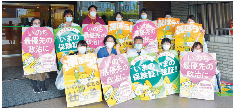
出発前集会にて(病院玄関前)

「核兵器禁止条約」署名と無低診・無料相談 案内のポスティングを行いました。 10月18日(金)、ポステ ィング行動を実施し、社 保・平和委員会のメンバ ーほか15名が参加。約1 時間の取り組みで、病院 周辺約500世帯に、「日 本政府に核兵器禁止条約 の署名・批准を求める」 署名と無料・低額診療事 業のお知らせ、無料健康 相談の案内チラシを入れ た配布物を配布しました。 参加した職員か らは、「初めて参加 した。病院周辺の 様子がわかった」 「無料・低額診療 事業や無料健康相 談のことをぜひ多 くの方に知ってほ しい」などの感想 が寄せられました。 (社保平和委員会)