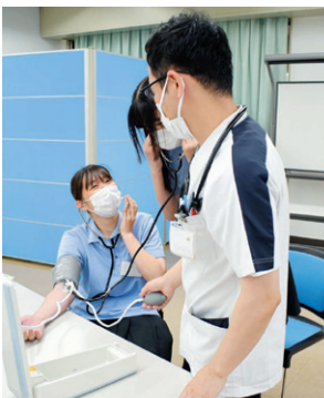
血圧を測る生徒さん

8月9日、古城池高校3年生17名を対象に「看護師・助産師・保健師の看護体験」を行いました。まず、看護師・助産師・保健師の業務内容や関わってきた患者さんとのエピソードなどについて説明し、グループに分かれ血圧測定や赤ちゃんだっこ体験、栄