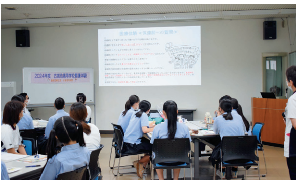
多くの生徒さんに来てもらいました

生徒さんから、「大変さも知ったがやりがいのある仕事」「助産師を目指し不安もあるが頑張ろうと思った」などの感想があり、今回の体験で医療の魅力を知っていただけて良かったと思いました。