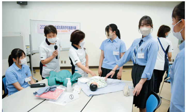
赤ちゃんだっこ体験のようす

8月9日、古城池高校3年生17名を対象に「看護師・助産師・保健師の看護体験」を行いました。まず、看護師・助産師・保健師の業務内容や関わってきた患者さんとのエピソードなどについて説明し、グループに分かれ血圧測定や赤ちゃんだっこ体験、栄