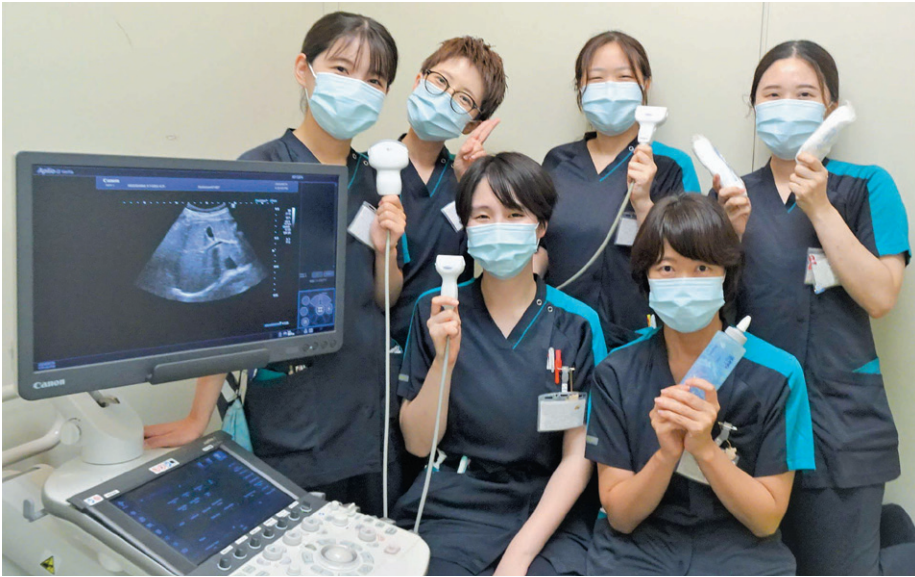
超音波検査を担当する6名の検査技師