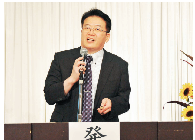
組合員さんを前に発表する院長