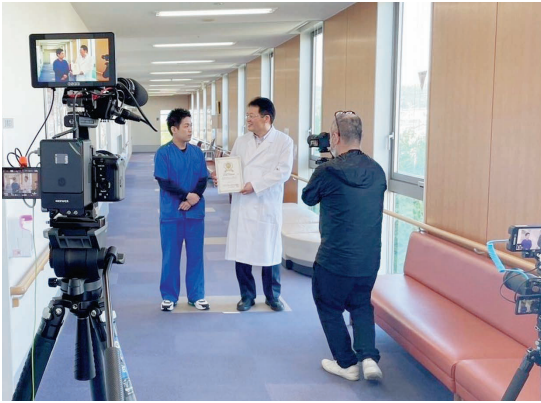
外来棟での撮影の様子

5月13日〜15日に、水島協同病院が加盟する全日本民医連が運用するサイト「イコリス」へ掲載する動画作成のための撮影・インタビュー取材を受けました。イコリスは、医師を目指す学生や研修医に向けた情報を発信