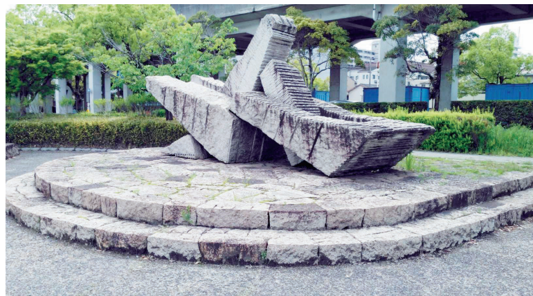
「組曲『海』一億万年の忘れ物」(寺田武弘 作)

水島臨海鉄道は、水島に入ると高架になって走ります。その高架側道は、弥生駅から水島駅まで2.5キロメートルにわたって遊歩道が整備され、「水と海と緑」をテーマにした世界的彫刻家の8点の彫刻モニュメントが設置されています。8つの作品名は、「水の精」(速水史郎 作)、「MA