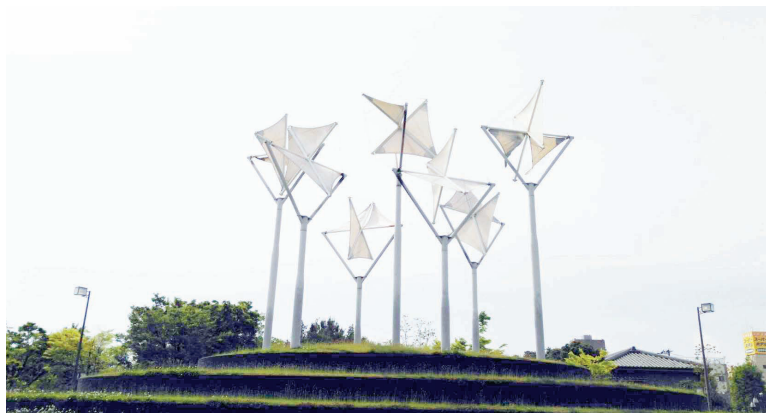
「白い森」(新宮 晋 作)