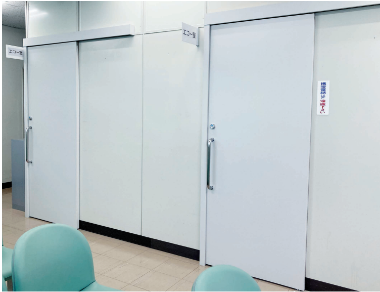
引き戸仕様で、車イスの方も入りやすくなりました