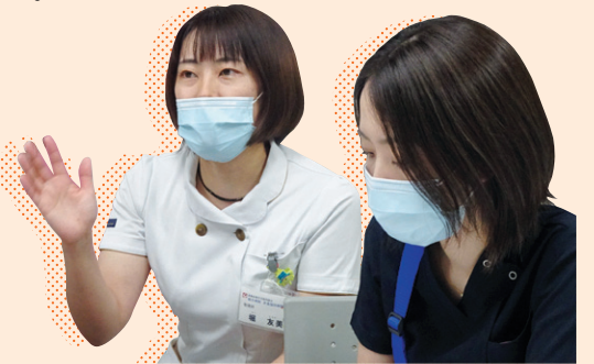
講師を務めた二人

参加した方から、「透析を受けている利用者様はいても、病院内でどのように実際行われているかな学習会を通じて、当院