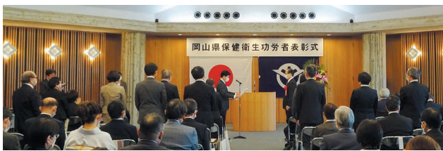
11/10、県庁にて表彰を受ける様子(本人は一番右端)

に関わってきました。また、2006年から15年間当院の病院長として、後進の育成や教育病院としての役割を大いに果たしてきました。これからも、先生の明るい笑顔と軽快なフットワークで、邁進されることと思います。今後先生のご活躍を願うとともに、私たちも先生の地域医療に対するとりくみを見習っていききたいと思っております。(医局事務課)