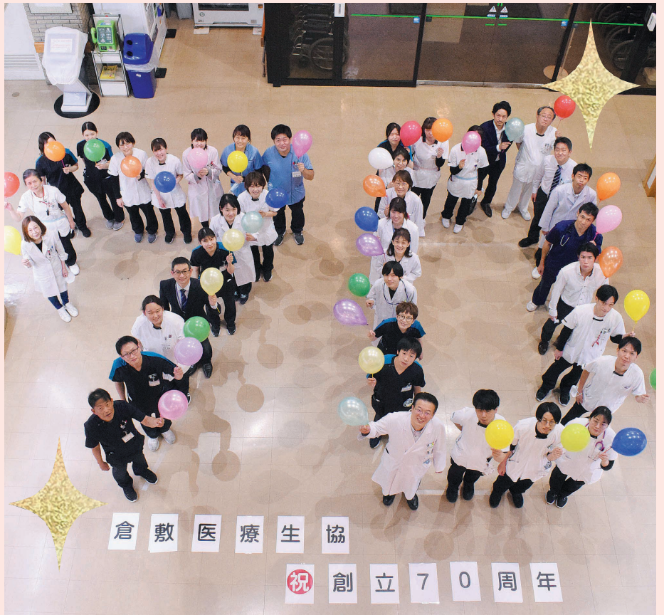
11/16 病院の玄関ロビーに集まって、「70」の人文字でアピール