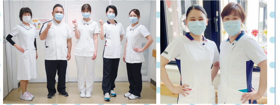
人工透析室(左)と3階北病棟(右)それから4階北病棟(右上)の看護師に協力してもらいました！

この4月より、外来と病棟看護師のユニフォームを、写真のように新しくしました。リニューアルに伴い、対象となる看護師からアンケートを集め、多くの声で選ばれたものです。 ユニフォームは白を基調とした、男女あわせて6種類の、いずれも襟元に特徴あるデザインとなっています。男性看護師は襟元がネイビーとターコイズブルーのスクラブ、女性看護師はワンピースタイプや、花びらのような丸い襟と茶系の2つのボタンがフェミニンな印象のチュニックを選ぶ人もいます。ボトムスは男女ともに、白とネイビーの2色で、上下の組み合わせはそれぞれの好みで選んでいます。 病院にはさまざまな職種のスタッフがいますが、新しいユニフォームをまとった爽やかな看護師をぜひ見つけてください。