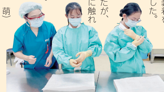
手術室看護師よりアドバイスをもらって手袋を装着