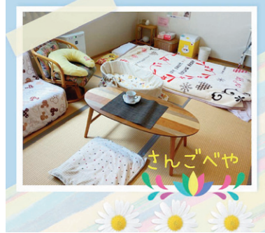
▲利用できるお部屋はこんな感じです

と2人帰宅困難になった方が、さくらんぼ助産院の宿泊産後ケアを利用されました。さくらんぼ助産院は他で出産される方も利用可能です。私たちは、全てのお母さんが少しでも安心して出産から子育てができるように、支援しておりますので、困ったことや聞きたい