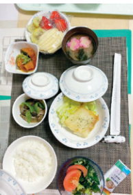
お食事は栄養科特製です