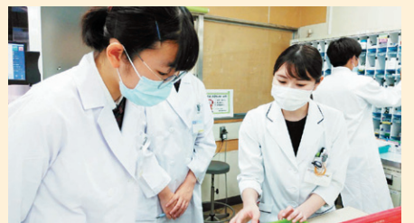
調剤についての話をきく生徒さん(左)