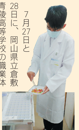
錠剤分包機に1つひとつ配置するようす