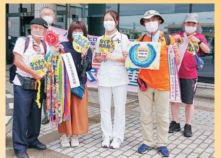
▲通し行進者に千羽鶴を託しました

7月22日(金)水島支所にて、「国民平和と大行進」水島集会が開催され、70名を超える人が参加しました。当院からも職員が多数参加し、職員有志で作成した千羽鶴を、行進団の代表に手渡しました。