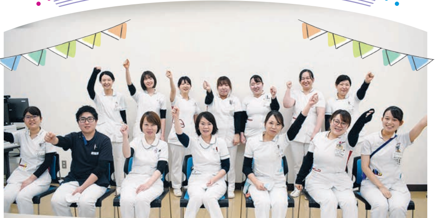
撮影のときのみマスクを外しています