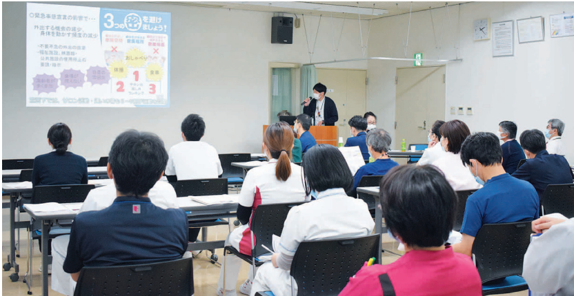
▲社協の方からの貴重な話に聴き入る職員たち

聴講した職員からは、「コロナ禍の中で、生活困窮者の実情の一端を知ることができた」「社協の多岐にわたる活動がよく理解できた。医療生協の活動ともよく協力してゆける内容と思う」「医療者ももっと地域の生活支援ネットワークに関わることが必要