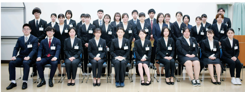
4/2、5に事業所研修がありました

2021年度もたくさんの新入職員を迎えました。初期研修医2人、薬剤師2人、看護師17人、理学療法士1人、作業療法士2人、臨床検査技師1人、臨床工学技士1人、管理栄養士1人、調理師1人、病院施設管理技術員1人、事務2人の総勢31人の、フレッシュな顔ぶれが水島協同病院に集まり、事業所研修が2日間にわたって、おこなわれました。現在は、各職場での研修がはじまっています。