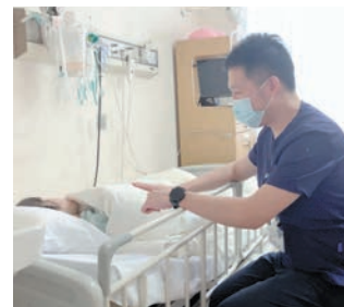
▲ベッドサイドで対話する様子

この2年間で、私にと って水島協同病院は、あ たたかい家族のような存 在になりました。頼れる 同期にも出会い、とても 充実した日々を過ごすこ とができました。すてき