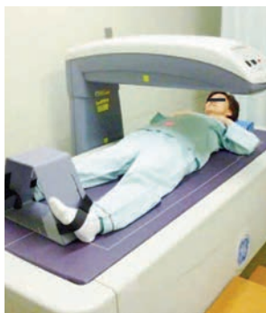
▲実際の検査の様子

また、重力のかけり方が弱 いと骨密度は低下しやすくな りますので、閉経前でも、体 重の軽い方、運動習慣の無い