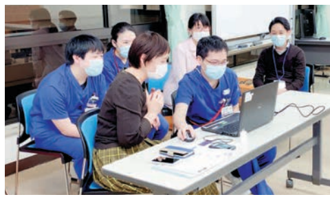
▲Web上で病院説明をする研修医たち