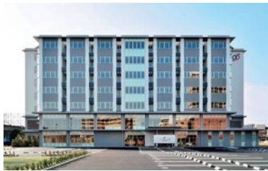
●コープリハビリテーション病院